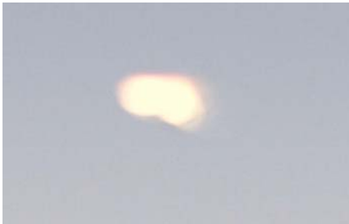
Utsnitt av lysflash