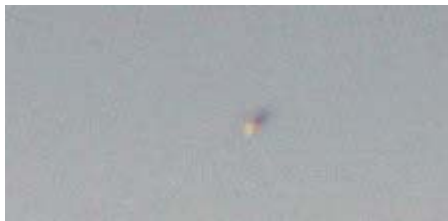
Utsnitt av objekt med sol og skyggeside